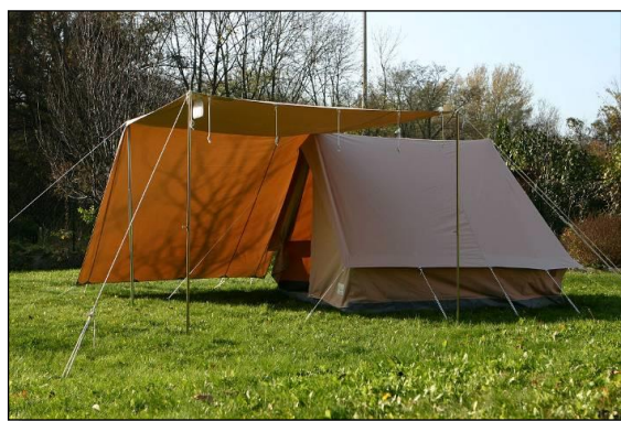
Abb. Hauszelt mit Vor-/Zwischendach

Zubehör: Packsack, Abspannleinen, Heringe „Thor“ 23cm, Bodennägel 6mm Ø