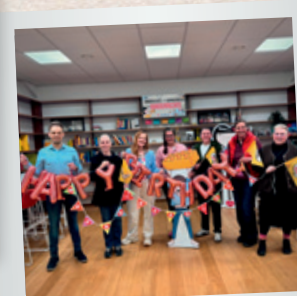
118 Jahre Kinderfreunde