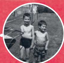
1966 mit seinem kleinen Bruder

Und neue Ideen gibt es längst wieder: Für die heurige Aktion „Ferien im Betrieb“ werden aktuell 250 Vogelhäuser vorbereitet, damit Kinder gemeinsam basteln und Natur erleben können. Wolfgang selbst bleibt dabei bescheiden: „Ich lerne von Kindern sehr viel – das hält jung.“