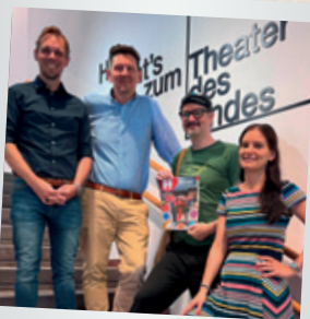
im Theater des Kindes

Ein motiviertes Team hat unser Feriendorf in Obertraun ausgewintert – auch wenn es teilweise Winter-Temperaturen hatte, sind wir nun bereit für den Sommer. Danke an alle fürs fleißige Mithelfen. ●