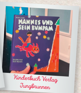
Kinderbuch Verlag Jungbrunnen