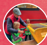
2025 aktive Heimstunden