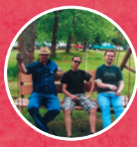
1992 Döbriach bei der Leiter:innen- Ausbildung